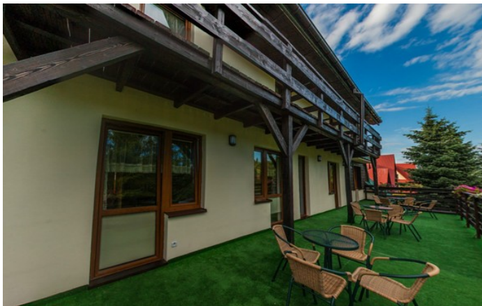
Ośrodek Wypoczynkowo - Szkoleniowy „Halny”

Dla naszej grupy jest zarezerwowany wstępnie cały Ośrodek Szkoleniowo-Wypoczynkowy „Halny” [ http://halnyzawoja.pl/ lub https://pl-pl.facebook.com/halnyzawoja/ ] w Zawoi (dzielnica Składy). Ośrodek oferuje smaczne wyżywienie mięsne i wegetariańskie. Więcej zdjęć znajduje się na stronie ośrodka.